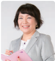
社会保険労務士・ キャリアコンサルタント 産業カウンセラー